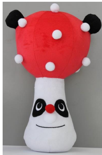
ぬいぐるみ 11月中旬発売 3種各3000円