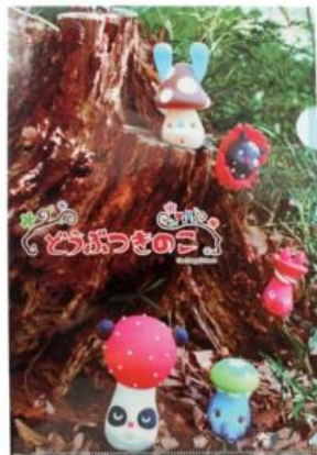
クリアファイル 11月発売2種各350円