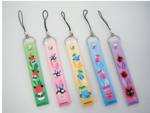
イメージストラップ 11月発売5種各840円