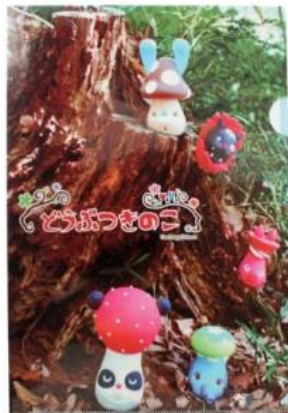
クリアファイル 11月発売2種各350円