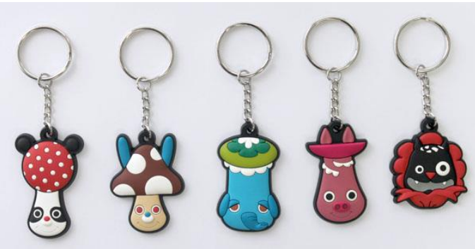
ラバーキーホルダー 11月発売5種各700円

価格は希望小売価格(税込み)です。 画像と実際の商品は一部異なることもございます。