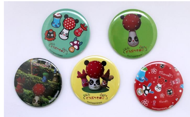
缶バッジ 11月発売5種各600円