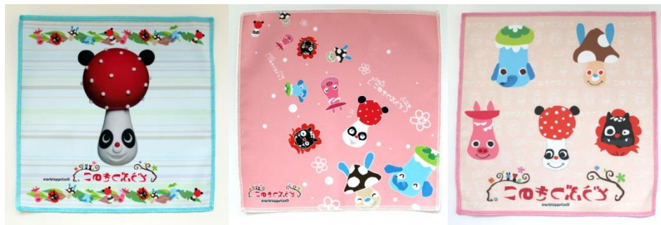
マイクロファイバーハンドタオル 11月発売3種各525円