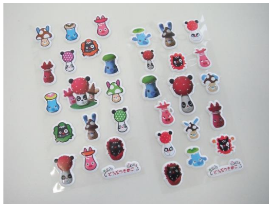
プクッとシール 11月発売2種各480円